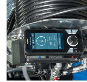
Standaard op CityJet met V1505-CR T diesel motor

De nieuwe eControl Touch is een platform dat is ontworpen voor de toekomst. Door gebruikers meer controle te bieden, wordt de machine efficiënter gebruikt en worden onderhoudskosten teruggedrongen. Gebruiksgemak, functionaliteit en duurzaamheid waren de belangrijkste pijlers bij de ontwikkeling van de eControl Touch. Hierdoor biedt de eControl Touch ongekende inzichten in diagnostiek en operationele informatie. Ook is er in het design rekening gehouden met toekomstige ontwikkelingen waaronder connectiviteitsmogelijkheden. Daarnaast helpt de eControl Touch om het water- en brandstofverbruik, de uistoot en het aantal bedrijfsuren te verminderen. Momenteel is de eControl Touch standaard op de CityJet met V1505-CR Turbo motor.