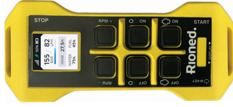
De nieuwe RioMore afstandsbediening heeft een LCD scherm dat alle informatie van de eControl Touch toont.

RIOCONNECT: MACHINE DATA OP UW TELEFOON Door middel van een app kunt u verbinding maken met eControl Touch. Op deze manier is het mogelijk data van uw machine ook op uw telefoon af te lezen. Handig als u voor vertrek wilt weten hoeveel water en brandstof u nog heeft.