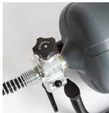
Transporteur automatique pratique