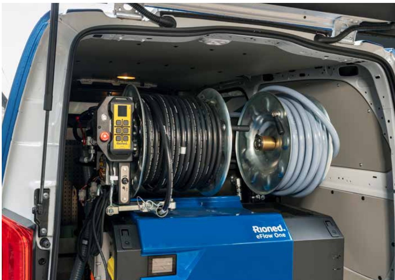
Volledig bestuurbaar met de RioMote