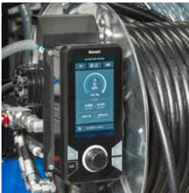
Standaard op CityJet met V1505-CR T diesel motor

Een belangrijk onderwerp bij de ontwikkeling van de eControl Touch was het toevoegen van meer real-time sensoren zodat gebruikers meer controle hebben op en inzicht hebben in waterdruk, waterverbruik, RPM's, brandstof- en waterniveaus. De sensoren monitoren ook continu de motor en andere kritieke onderdelen. Waarschuwingen en foutmeldingen worden direct weergegeven op de eControl Touch. Maar dat is niet het enige: op het 7" LCD scherm worden ook mogelijke oplossingen om het probleem te verhelpen weergegeven. Dit zorgt voor verminderde onderhoudskosten en downtime van machines.