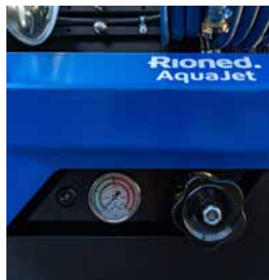
Nieuw ergonomisch design