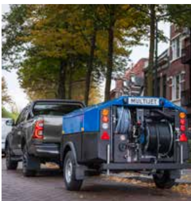
90° + 180° zwenkbare hogedrukhaspel