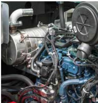
Tier 4/Stage V motor met ingebouwd roetfilter en katalysator

Het lichtgewicht frame van versterkt aluminium is compact en dat maakt de ProfiJet T4 bij uitstek geschikt voor de meeste middelgrote bestelauto's zoals de Mercedes Sprinter, Volkswagen Crafter of Iveco Daily. Twee separate watertanks van 400 liter elk zijn met elkaar verbonden voor een stabiele wegligging en comfortabel rijgedrag. De watercapaciteit is uitbreidbaar tot 1.600- of zelfs 2.400 liter. Een slanglengte meterteller hoort tot de standaarduitrusting, handig om te zien hoe ver de slang in het riool zit of hoeveel meter er gereinigd is. Aan de machine kan nog een tweede hogedruk haspel toegevoegd worden om ook kleinere leidingen met veel bochten te reinigen.