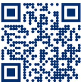
Scan QR-code voor productvideo