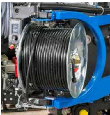
Draai- en zwenkbare haspel