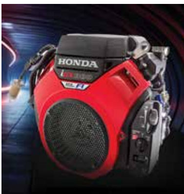
De compleet vernieuwde AquaJet met injectiemotor

De AquaJet is beschikbaar in verschillende capaciteiten. Door de sterkere injectiemotor is de AquaJet nu leverbaar in een 200 bar / 45 lpm versie, 160 bar / 55 lpm versie en een hoog-debiet machine van 140 bar / 70 lpm. Ideaal voor het ontstoppen van huisaansluitingen maar ook inzetbaar in grotere buizen tot zo'n 350 mm. De 60 meter lange, licht gewicht MaxFlow hogedrukslang heeft een ultra-glad binnenwerk en een ruimere binnendiameter voor minimaal drukverlies. Uiteraard wordt ook deze machine geleverd met 2 jaar Rioned garantie.