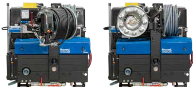
Optioneel verkrijgbaar met zwenkbaar haspel.