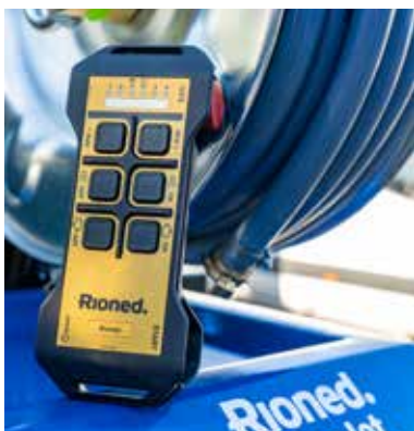
Op afstand starten en bedienen van de machine