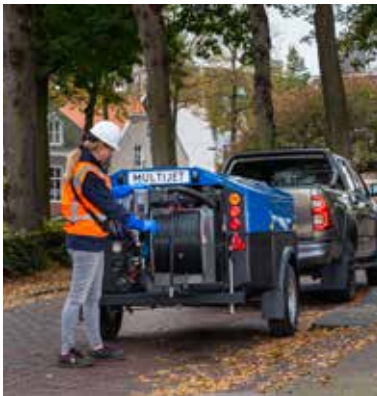
800 liter water aan boord

De effectieve opbrengst van de MultiJet is hiermee verder verhoogd, waardoor de spuitkop een hogere werkdruk levert. Uiteraard kan de MultiJet met afstandsbediening worden uitgerust voor optimaal bedieningsgemak door één persoon. Ook een optie voor oliespoorreiniging behoort tot de mogelijkheden.